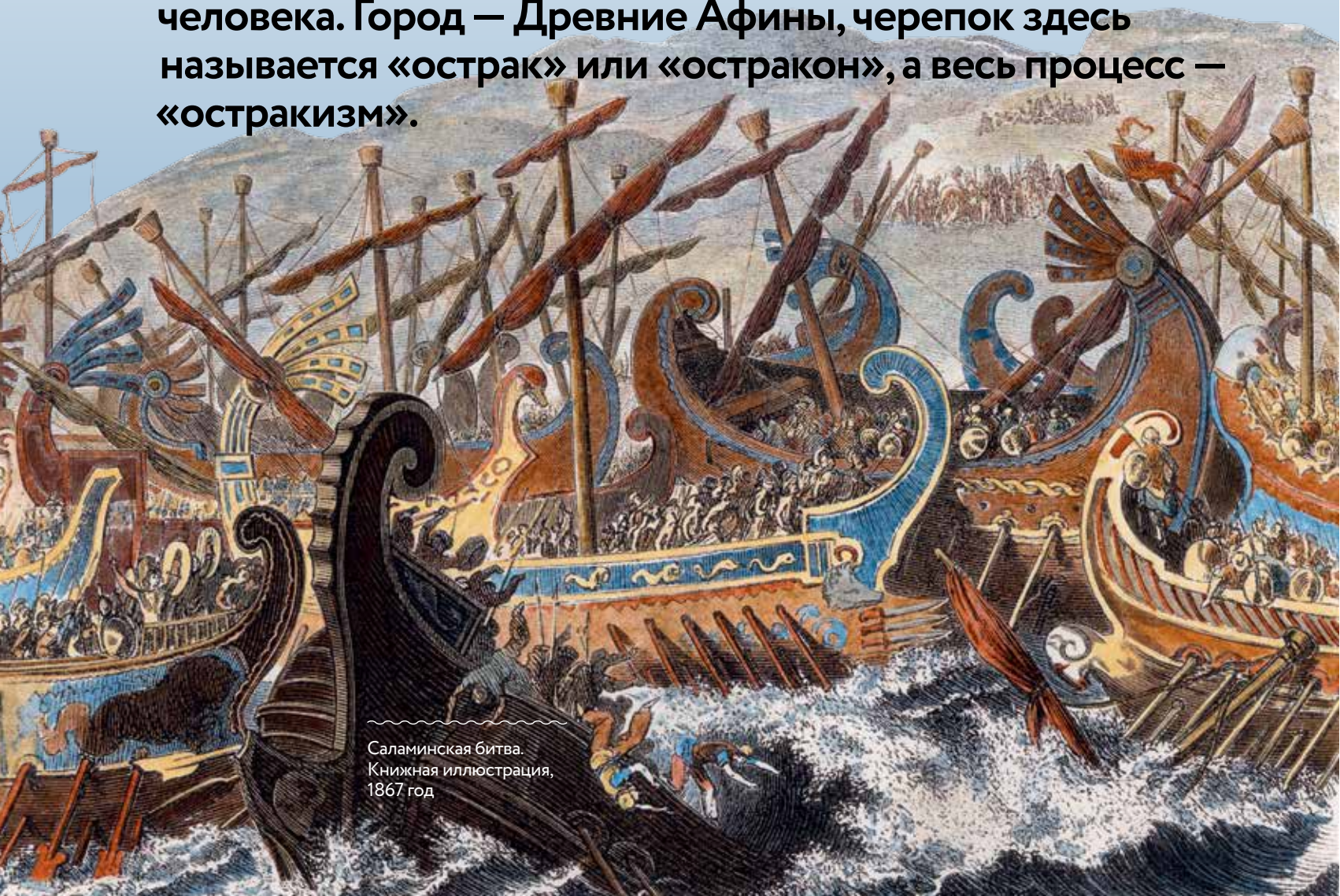
Саламинская битва. Книжная иллюстрация, 1867 год

Представьте себе группу людей, которые собирают множество черепков, внимательно читают, что на них нацарапано, записывают что-то, считают, а потом объявляют результаты своих изысканий. Цель этого мероприятия не восстановление разбитых горшков, но изгнание из города опасного для государства человека. Город — Древние Афины, черепок здесь называется «острак» или «остракон», а весь процесс — «остракизм».