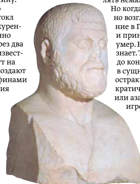
Фемистокл. Римская копия древнегреческого бюста V века до н. э.

Но когда ему было предложено возглавить новое вторжение в Грецию, он отказался и принял яд. Или просто умер. Никто в точности не знает. Так же, как никому до конца непонятно, чем, в сущности, был греческий остракизм: разумной демократической процедурой или азартной политической игрой в черепки. ▽