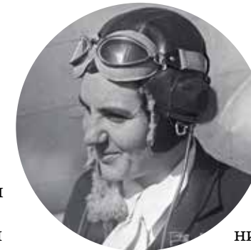
Валентина Степановна Гризодубова. Фото 1938 года

Среди обладателей звания было немало женщин. Первой удостоилась этой награды лётчица Валентина Гризодубова (ноябрь 1938 года). Кроме неё, до июня 1941-го звание героя было присвоено ещё двум женщинам. Вели-