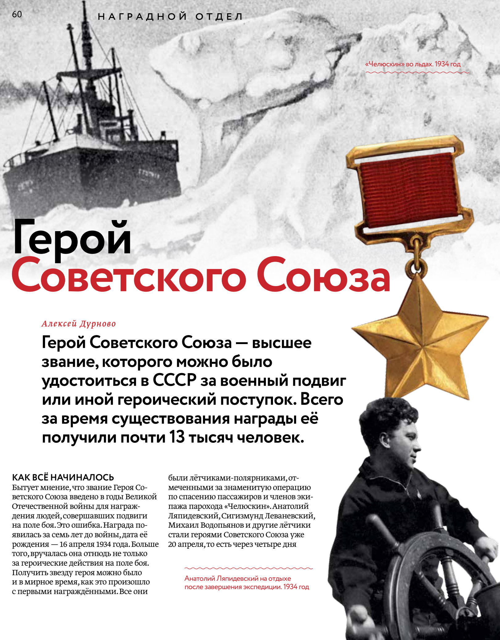
«Челюскин» во льдах. 1934 год