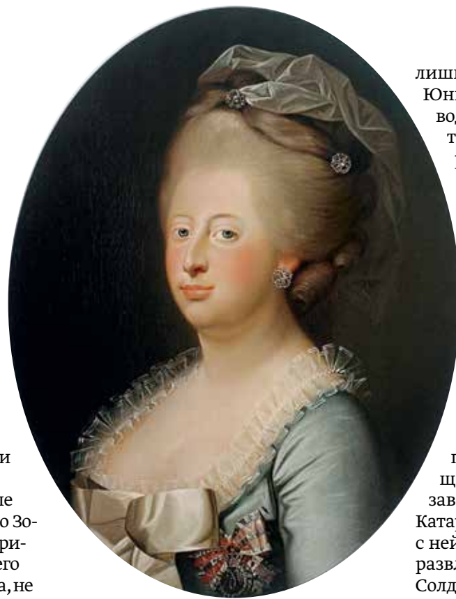
Королева Каролина Матильда. Йенс Юль, 1771 год

Кристиан не разделял отцовской любви к искусствам. У него была