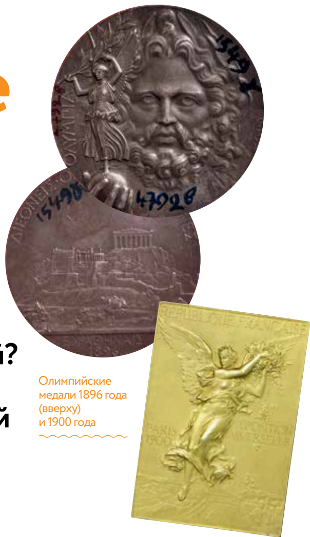
Олимпийские медали 1896 года (вверху) и 1900 года

Тогда и родилась мысль о медалях. Официально они в качестве главной олимпийской награды были утверждены на I Олимпийском конгрессе в 1894 году. Вот только первоначально медалей было лишь две. Победителю — из серебра с позолотой, а спортсмену, ставшему вторым, — из бронзы. Также история повторилась и в Париже в 1900 году. И лишь в 1904-м, когда Олимпиаду принимал американский Сент-Луис, отмечать почётными знаками решили уже не двоих, а троих спортсменов. Но до золота опять дело не дошло. Победитель получал медаль, сделанную из серебра, но покрытую золотой эмалью. И вот тогда-то МОК и решил, что это, наверное, не очень правильно, и чемпионы следующей Олимпиады, лондонской, в 1908 году впервые получили медали, сделанные из чистого золота.